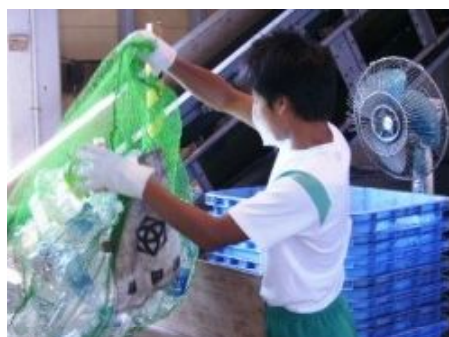
2年生で行う職場体験活動

*職場体験学習は、2～3日間職場に出かけて、実際に仕事をを行います。働いてみることによって今までと自分の将来に対する考えが少し変わってきます。