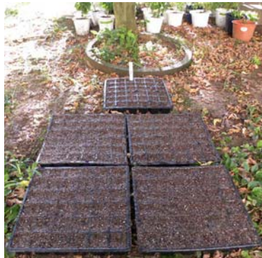
ふじだな した 藤棚の下です。