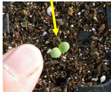
ゆび おとな ひとさ ゆび 指は大人の人差し指です。